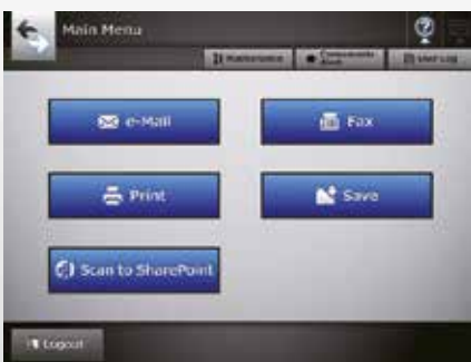
Pantalla de menú principal