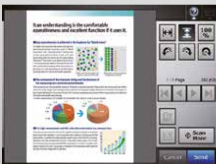
Pantalla de previsualización (Visor de escaneado)